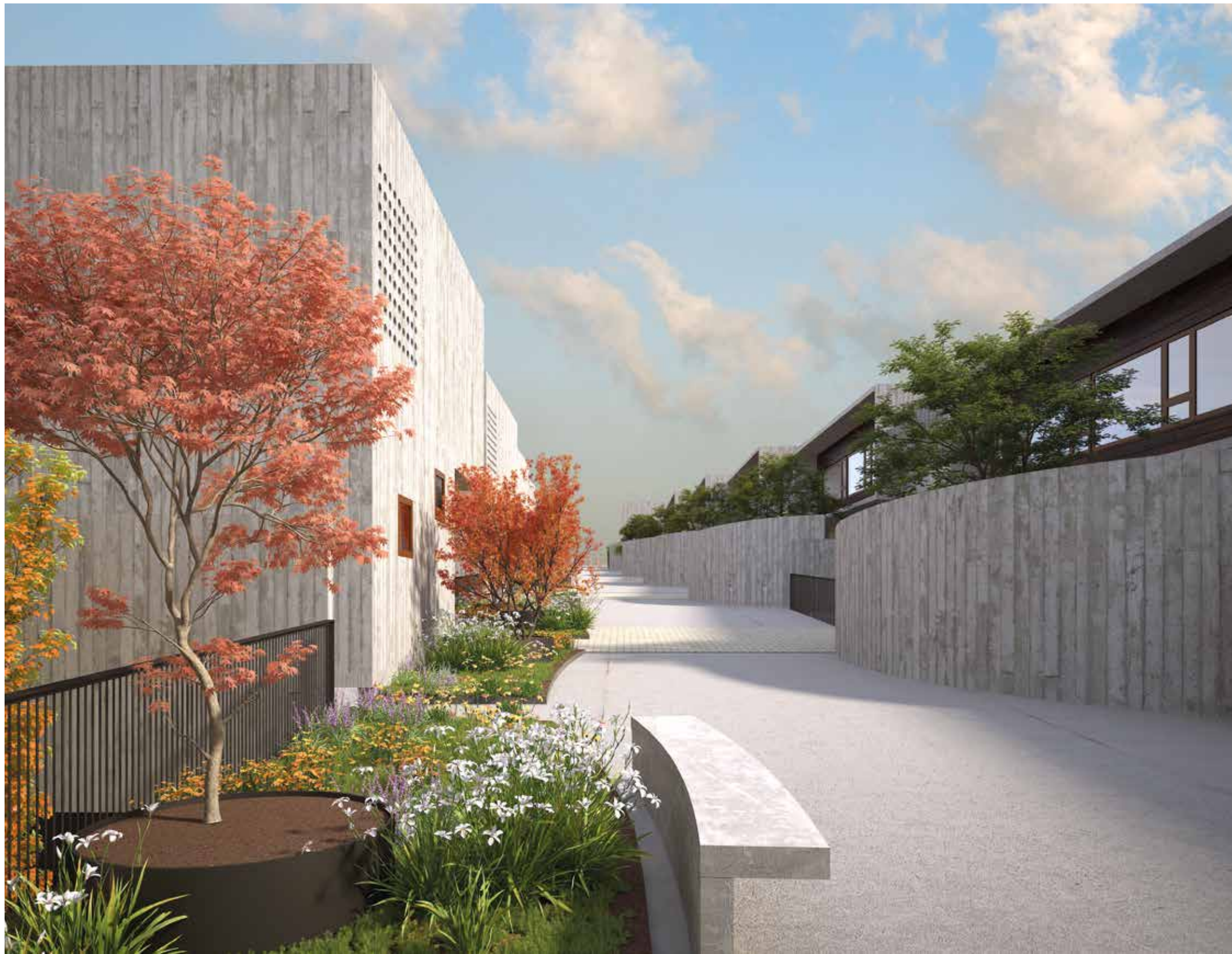
PASEO CENTRAL PEATONAL EN PRIMER NIVEL